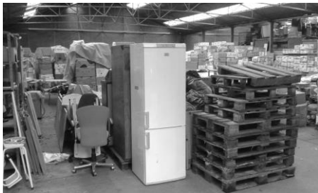
Broechem, na de verhuis.