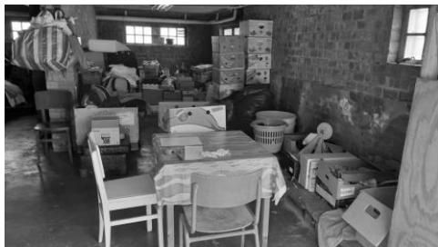
Inpaklokaal in Wilrijk.

We zijn meteen op zoek gegaan en hebben iedereen bevroegd of ze een betaalbare alternatieve locatie hadden waarin wij onze activiteiten konden verderzetten. Tot dusver leverde dat niets op. We zouden heel graag een inzamelpunt blijven behouden in de omgeving van het centrum van Wilrijk en doen dan ook hier een oproep. Idealiter is er stroom en verlichting en is het makkelijk met de wagen bereikbaar. Sanitaire voorzieningen en verwarming zijn geen must.